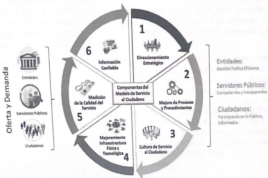
Gráfica 2. Componentes gestión del servicio al ciudadano