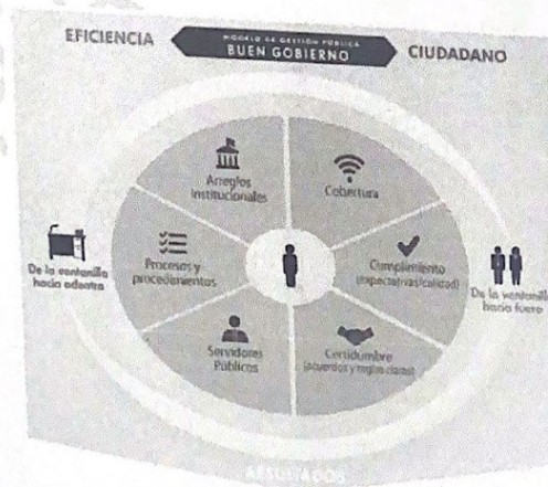
Gráfica 1. Modelo gestión pública al servicio del ciudadano

• Efectividad • Colaboración • Información / servicios compartidos